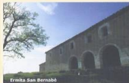
Ermita San Bernabé